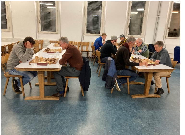
Impressionen der ersten Runde